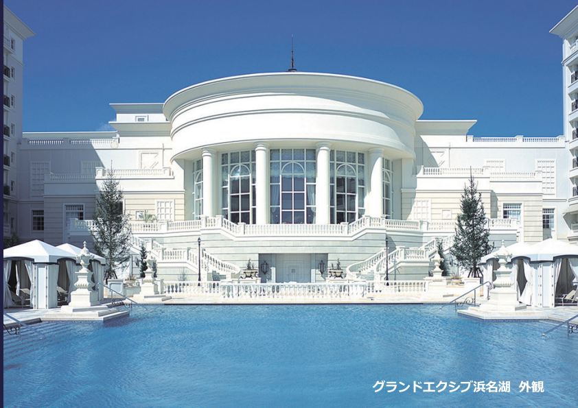
グランドエクシブ浜名湖 外観

*メンバー様及びそのゲスト様以外ご宿泊になれませんが、 一部のレストラン等は一般のお客様も一定の条件のもとでご利用になれます。